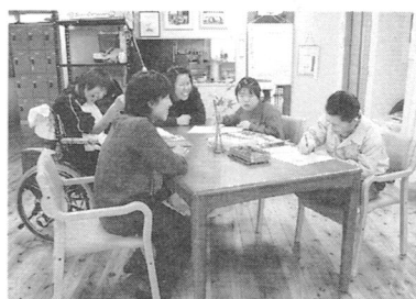
あんしんデイサービス