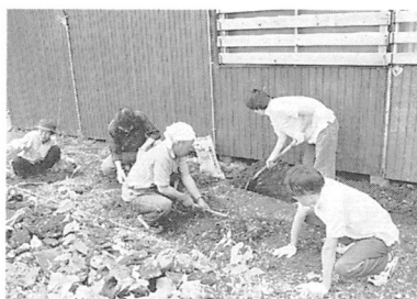
グループホーム「若竹」みんなで庭づくり

具体的には、障がい者にトイレットペーパーの生産など、様々な仕事を提供して、自立支援をするワークセンターあんしん、生活の場を提供するグループホームやデイサービス、行政から委託を受け障がい者や障がい児の送迎を行う送迎事業などを行っています。